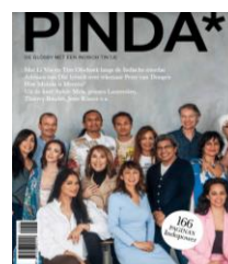
Magazine Pinda (sept/2019)